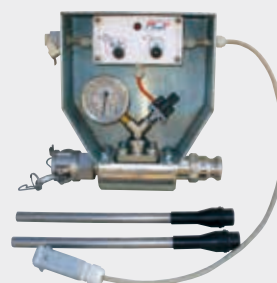
Kit de inyección P 731