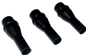
3 boquillas para juntar Ø 10, Ø 12 et Ø 14