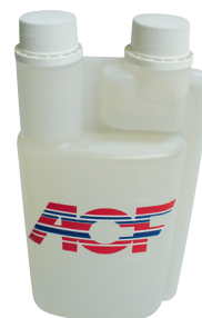
Lata de 0.50 litro de aditivo hidráulico ACF P 645