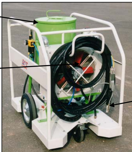
Buse pour gommage humide