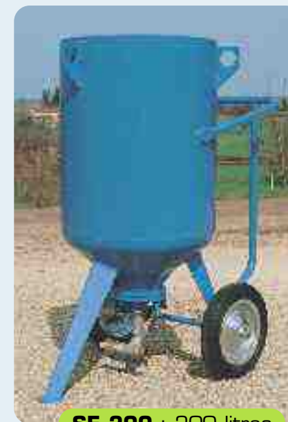
SE 200 : 200 litros