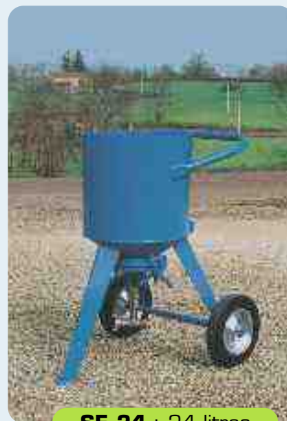
SE 24 : 24 litros