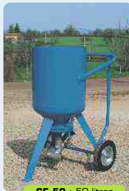
SE 50 : 50 litros