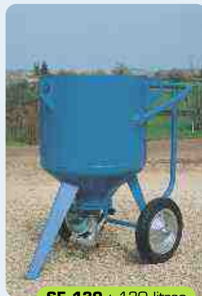
SE 130 : 130 litros