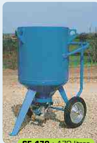
SE 170 : 170 litros