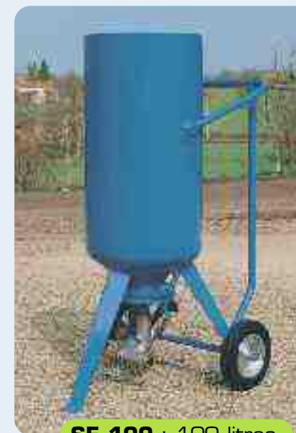
SE 100 : 100 litros