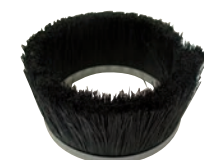
Brosse droite S 859

La puissance d'aspiration permet de travailler avec des buses de sablage de 3 ou 4 mm et le choix de l'abrasif est fonction du support à nettoyer. Dans certaines conditions, le recyclage de l'abrasif pourra être effectué. En cas d'utilisation de corindon, il est recommandé d'utiliser des buses en carbure de bore.